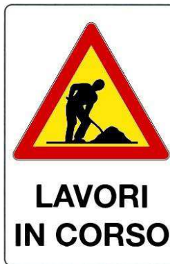
Lavori in corso