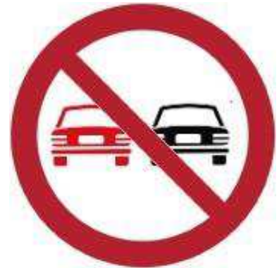
Divieto di sorpasso